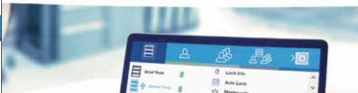
Gestion simple et conviviale des serrures sur un PC

Avec le logiciel Access de LISTA, vous bénéficiez d'une solution particulièrement simple et conviviale pour gérer votre code LISTA, RFID ou AUTO Lock. Il permet aux utilisateurs et groupes d'utilisateurs de se familiariser et de gérer les serrures de manière rapide et automatique via USB. Il offre également des fonctions supplémentaires telles que la modification du Lock ID Code ou la création de permissions et de restrictions d'accès temporelles à l'aide de tableaux d'affectation clairs.