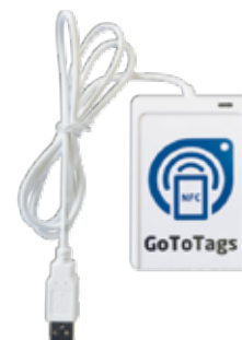
Lecteur de cartes RFID pour PC Réf. 19.591.000