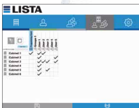
Attribuer des autorisations d'accès en un seul clic